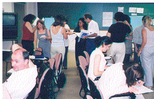
A dinâmica da reunião: participantes reunidos em grupos para discutir os temas propostos.